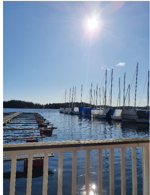
Nå nærmer båtsesongen seg

For å forebygge skader på egen og andres båt, samt på det elektriske anlegget i båthavna, må alle se til at: